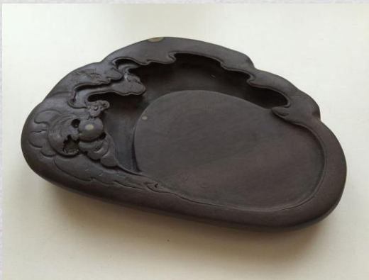
Резной чернильный камень