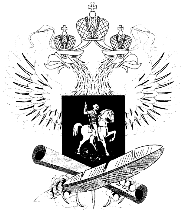
Рисунок геральдического знака – малой эмблемы Министерства просвещения Российской Федерации